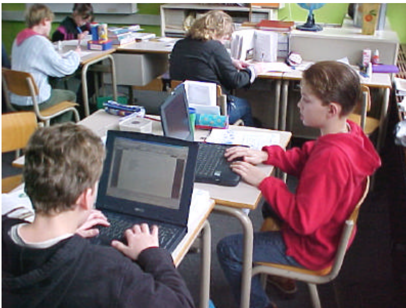
Foto 4 Laptop gebruik

De laptops zijn vanwege de flexibiliteit en beperkte ruimte per leerling voor desktops veel in gebruik. De school zou nu graag over 30 laptops voor leerlingen willen beschikken. Schade aan laptops is nog nauwelijks opgetreden, ondanks intensief gebruik.