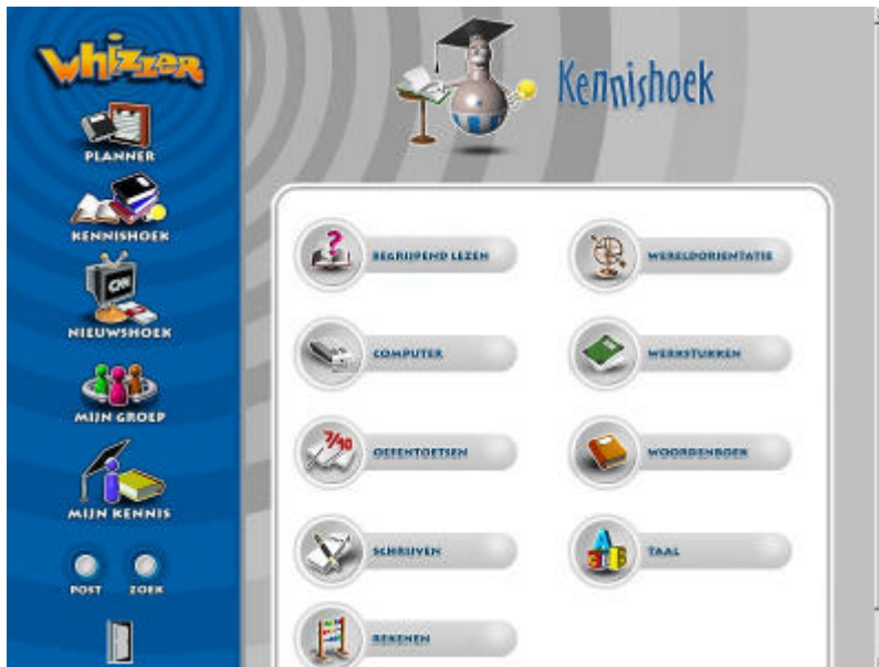
Foto 5 Whizzer, de kennishoek

De school vindt een elektronische leeromgeving als Whizzer nog steeds een zeer belangrijk middel voor de organisatie van het onderwijsleerproces. Door onvoldoende passende content is echter op dit moment het gebruik zeer beperkt. Het project van de taakplanner voor de leerlingen is gestopt.