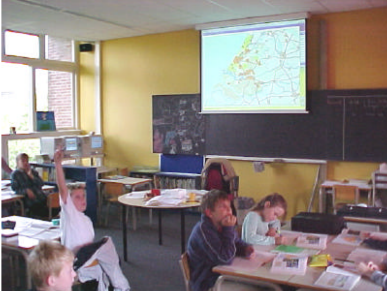
Foto 3 Beamer in ieder lokaal