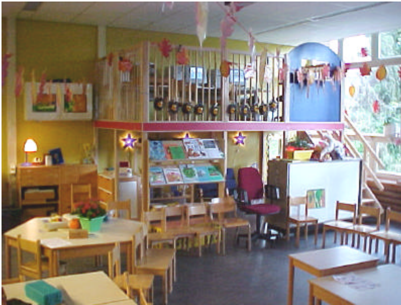
Foto 7 Kleuterlokaal met vide met computers